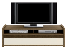
GRIVEL 23 szafka TV z 1 szufladą wys. x szer. x gł. 436 x 1438 x 508