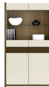
GRIVEL 12* witryna 4 drzwiowa z 1 szufladą wys. x szer. x gł. 1940 x 1100 x 412