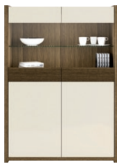
GRIVEL 02* szafka-barek 4 drzwiowa wys. x szer. x gł. 1516 x 1100 x 412