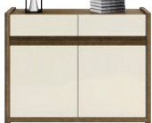
GRIVEL 47 komoda 2 drzwiowa z 2 szufladami wys. x szer. x gł. 850 x 1100 x 412