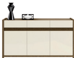
GRIVEL 48 komoda 3 drzwiowa z 3 szufladami wys. x szer. x gł. 850 x 1612 x 412