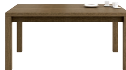
GRIVEL 40 stół rozkładany wys. x szer. x gł. 600 x 1600/2100 x 900