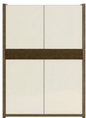
GRIVEL 01* szafka z barkiem 4 drzwiowa z 1 szufladą i oświetleniem wys. x szer. x gł. 1516 x 1100 x 412