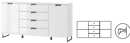
MEGAN 04 komoda 2-drzwiowa z 4 szufladami szer. x wys. x gł. 160 x 85 x 38 cm

dresser with 4 drawers W x H x D 80 x 85 x 38 cm