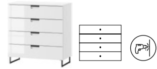
MEGAN 03 komoda z 4 szufladami szer. x wys. x gł. 80 x 85 x 38 cm

1-door dresser with 4 drawers W x H x D 120 x 85 x 38 cm