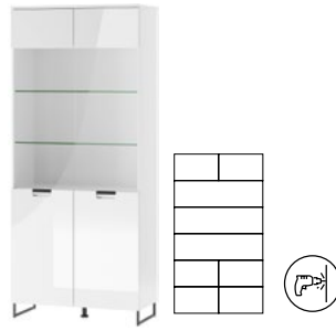
MEGAN 07 witrażyna wysoka 2-drzwiowa (oświetlenie opcjonalne) szer. x wys. x gł. 85 x 197 x 38 cm

1-door display cabinet L/P (optional lighting) W x H x D 55 x 197 x 38 cm