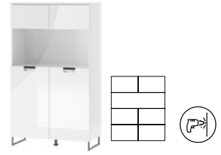
MEGAN 08 witrażyna niska 2-drzwiowa (oświetlenie opcjonalne) szer. x wys. x gł. 85 x 147 x 38 cm

tall 2-door display cabinet (optional lighting) W x H x D 85 x 197 x 38 cm