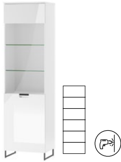
MEGAN 06 witrażyna 1-drzwiowa L/P (oświetlenie opcjonalne) szer. x wys. x gł. 55 x 197 x 38 cm

1-door display cabinet L/P (optional lighting) W x H x D 55 x 197 x 38 cm