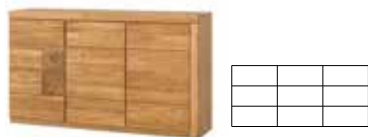
VELLE 45 kredens 3-drzwiowy szer. x wys. x gł. 160 x 94 x 42 cm

bookcase (lighting in standard) W x H x D 95 x 202 x 40 cm