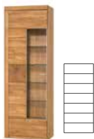
VELLE 10 L witryna 1-drzwiowa oświetlenie opcjonalne szer. x wys. x gł. 65 x 202 x 42 cm

1 door display unit L optional lighting W x H x D 65 x 202 x 42 cm