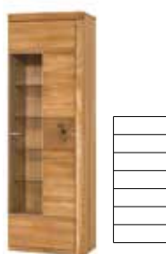
VELLE 11 P witryna 1-drzwiowa oświetlenie opcjonalne szer. x wys. x gł. 65 x 202 x 42 cm

1 door display unit L optional lighting W x H x D 65 x 202 x 42 cm