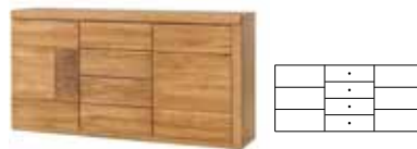
VELLE 46 kredens 2-drzwiowy z 4 szufladami szer. x wys. x gł. 180 x 94 x 42 cm

3 door dresser W x H x D 160 x 94 x 42 cm