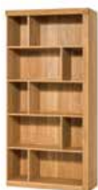
VELLE 16 regał (oświetlenie w standardzie) szer. x wys. x gł. 95 x 202 x 40 cm

2 door display unit optional lighting W x H x D 95 x 147 x 42 cm