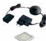
3-L-BZ-1-0000-01 zestaw oświetleniowy do montażu podwieńcowego 1 x square, 1 x transformator Do modeli Visio: 10, 12, 15, 46

Lighting system of a glass shelf 3 x LED clip, 1 x transformer for models Visio: 10, 12