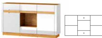
VISIO 46 komoda 2-drzwiowa z 2 szufladami opcjonalne oświetlenie szer. x wys. x gł. 160 x 89 x 40 cm

2-door 1 drawer TV unit W x H x D 160 x 46 x 40 cm