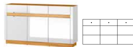
VISIO 45 komoda 3-drzwiowa z 3 szufladami szer. x wys. x gł. 160 x 89 x 40 cm

2-door 2 drawer sideboard optional lighting W x H x D 160 x 89 x 40 cm