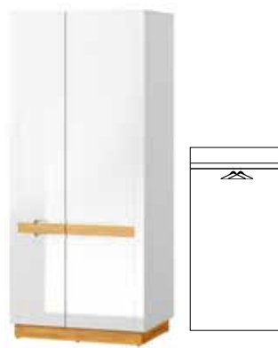
VISIO 70 szafa ubraniowa 2-drzwiowa szer. x wys. x gł. 86 x 198 x 60 cm

2-door display unit optional lighting W x H x D 86 x 198 x 40 cm