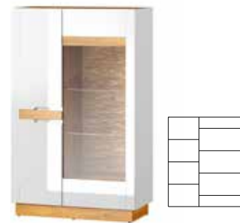
VISIO 15 witryna 2-drzwiowa opcjonalne oświetlenie szer. x wys. x gł. 86 x 137x 40 cm

2-door wardrobe W x H x D 86 x 198 x 60 cm