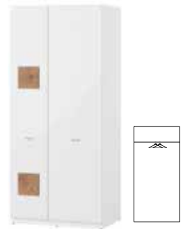
WOOD 70 szafa 2-drzwiowa szer. x wys. x gł. 89 x 200 x 58 cm