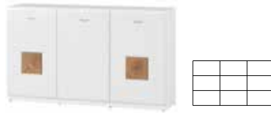
WOOD 45 komoda 3-drzwiowa szer. x wys. x gł. 154 x 90 x 40 cm