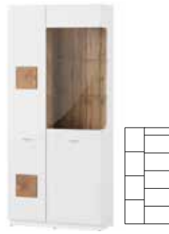
WOOD 12 witryna 2-drzwiowa opcjonalne oświetlenie szer. x wys. x gł. 89 x 200 x 40 cm