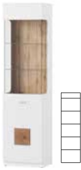
WOOD 10 witryna 1-drzwiowa L/P opcjonalne oświetlenie szer. x wys. x gł. 52 x 200 x 40 cm