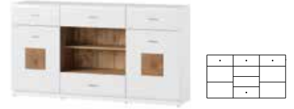
WOOD 46 komoda 2-drzwiowa z 4 szufladami szer. x wys. x gł. 168 x 90 x 40 cm