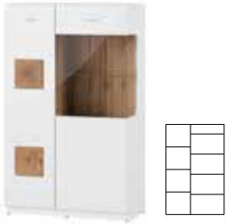
WOOD 15 witryna 2-drzwiowa opcjonalne oświetlenie szer. x wys. x gł. 89 x 145 x 40 cm